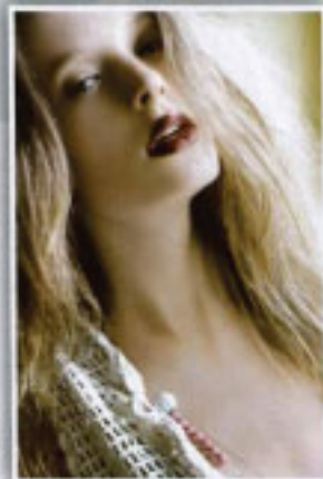
Per la cura quotidiana del viso Thalmar Dream Anti Age Ossigenato di STS (€ 32,99) una texture ricca e soffice che si assorbe rapidamente con un leggero messaggio.

Formule che stimolano la respirazione cellulare e regalano alla pelle una luce naturale