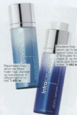
Rejuvenation Daily serum eller Absolene Daily serum, der fungerer næsten blot ved at få muskler til at ryste af og dermed fjerne dybe rynker. 1.452 kr.

Jeg tror på, at når en kvinde virkelig FØLER sig smuk og godt tilpas, udstråler hun også skønhed. For mig er skønhed i højeste grad en sindstilstand, en følelse. En kvinde kan bruge alle de bedste produkter i verden og få foretaget de nyeste og mest effektive